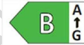
Şekil 2: Enerji verimliliği sınıflarının aralığını gösteren renkli sol ok

3. Yönlendirmeli gösterim durumunda, etiketin görüntülenme sırası aşağıdaki gibi olacaktır.